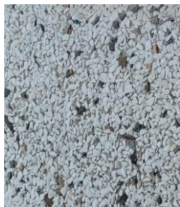
Мрамор с базальтом