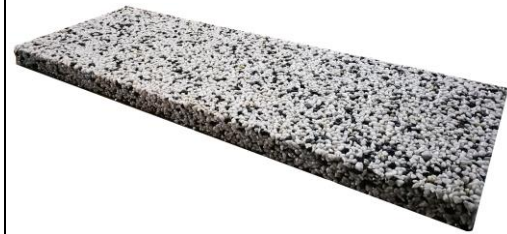
Навершие забора прямое Цена : 1200,00

Длина 500 Ширина 300 Высота 90 Вес 15 кг