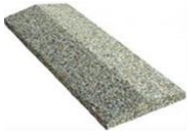
Навершие забора 2*скатное Цена: 550,00

Длина 500 Ширина 300 Высота 90 Вес 15 кг